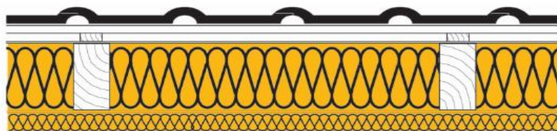
Dach 1 - izolacja z wełny mineralnej

Wartość U = 0,18 W/(m 2 x K) Tłumienie amplitudy (1/TAV) = 6 (TAV = 17%) Przesunięcie fazy φ = 6,8 godzin